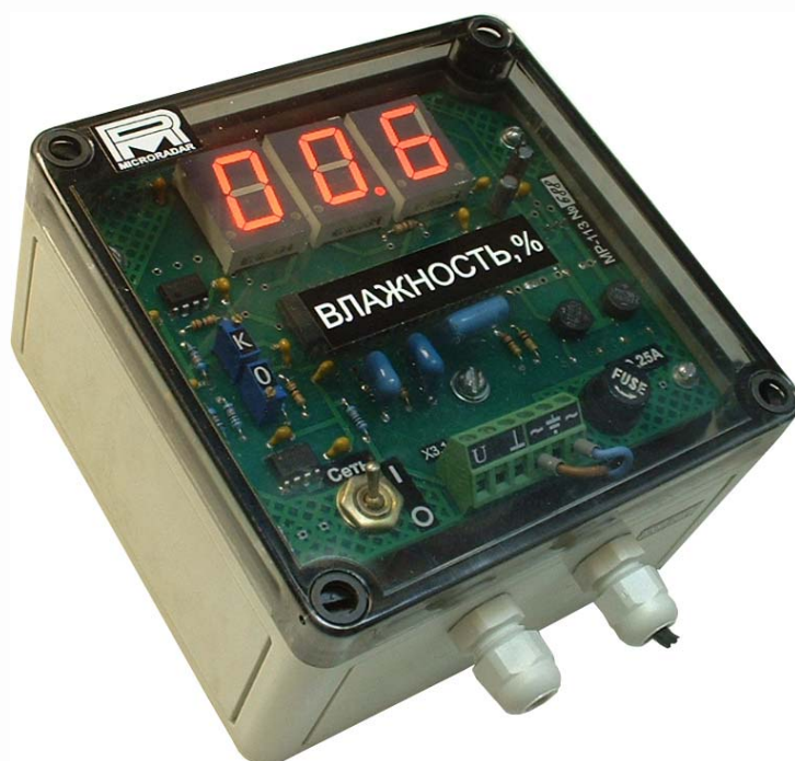
Рис. 1. Внешний вид блока индикации