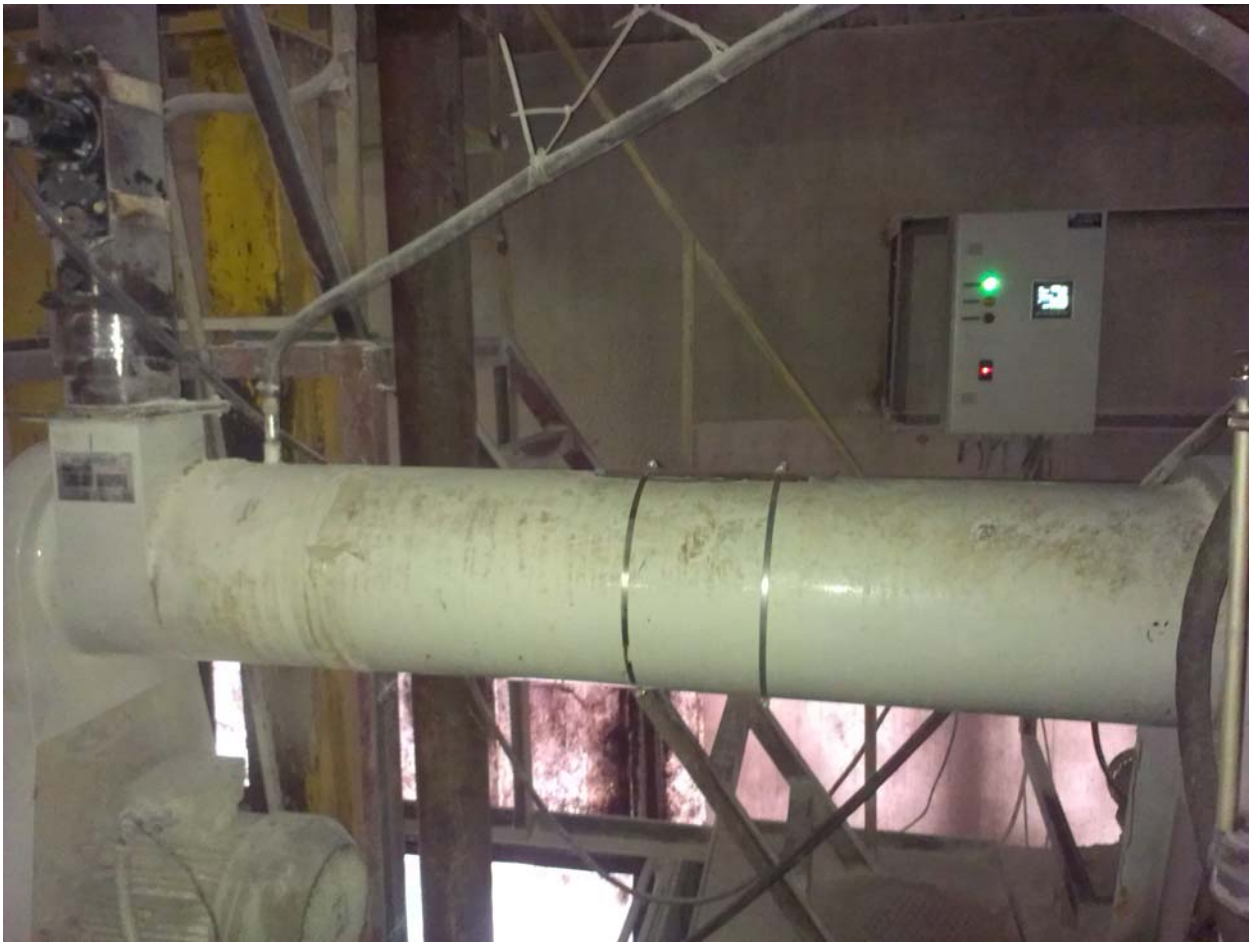
Общий вид БШУ