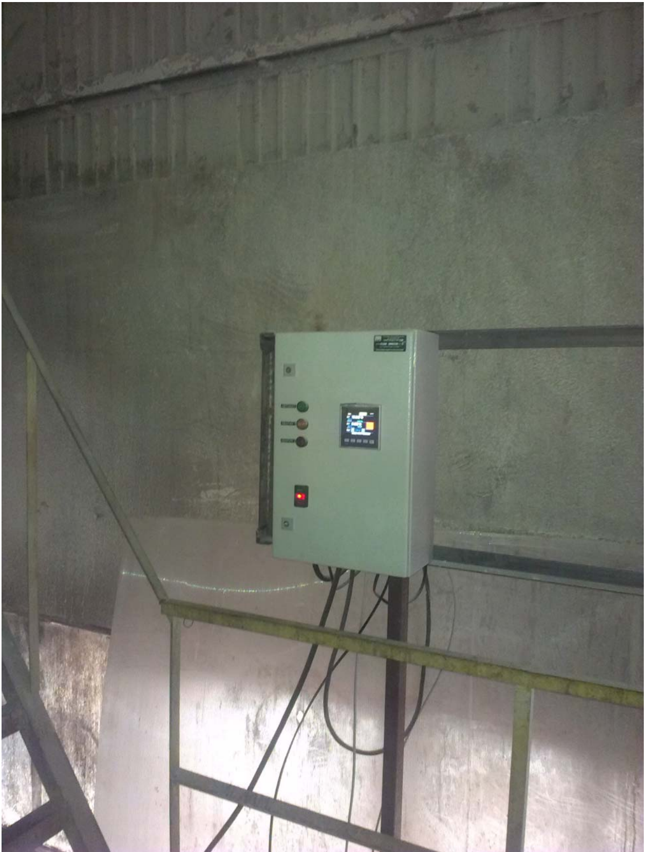
Силовой шкаф системы