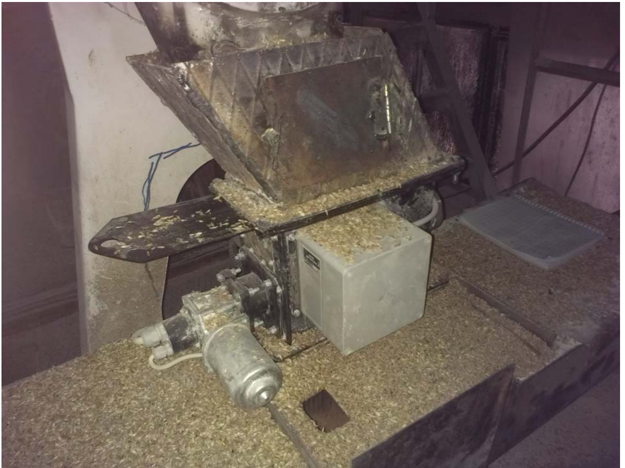
Установка влагомера на входе в БШУ