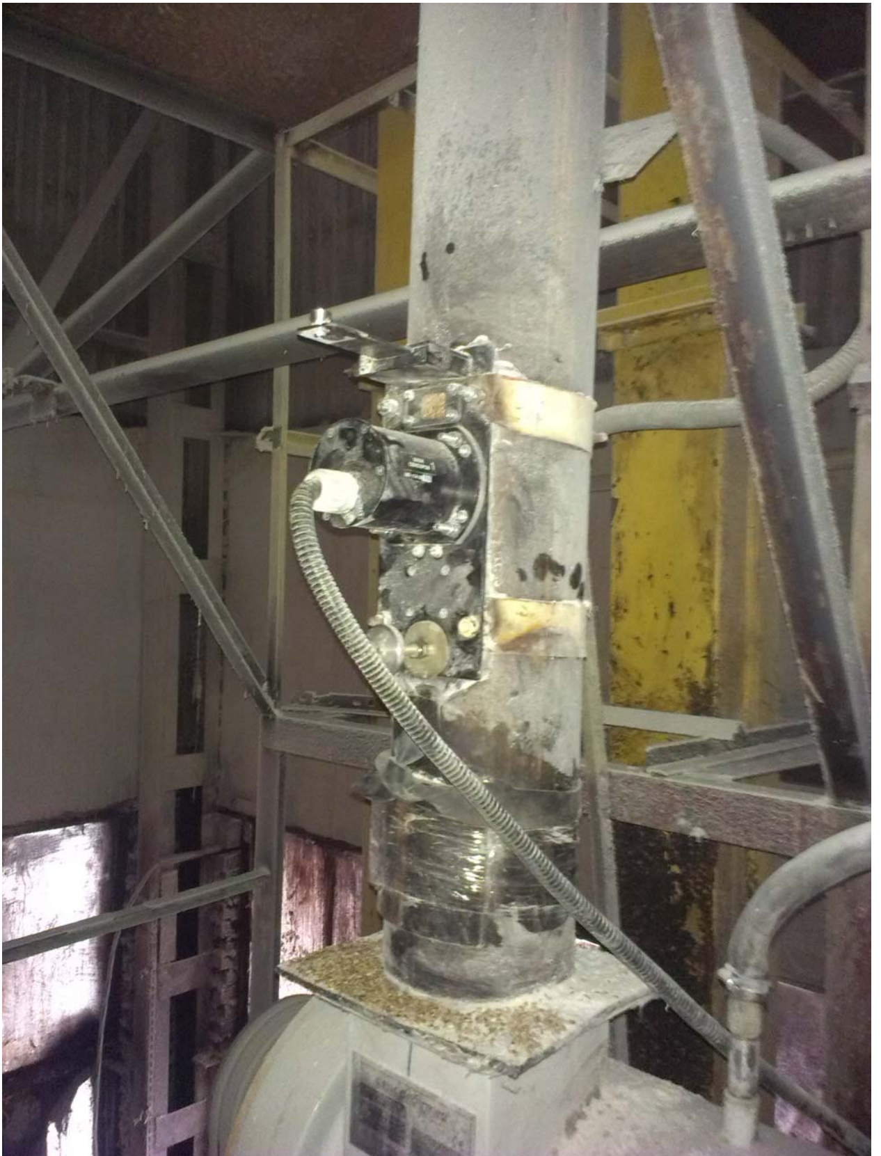
Общий вид влагомера на входе в БШУ