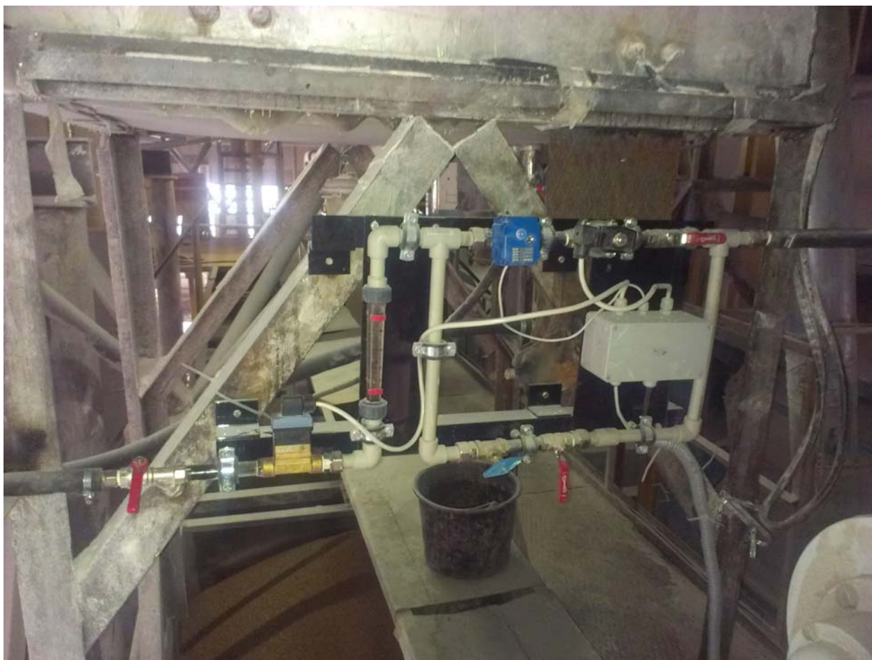
Общий вид гидропанели системы