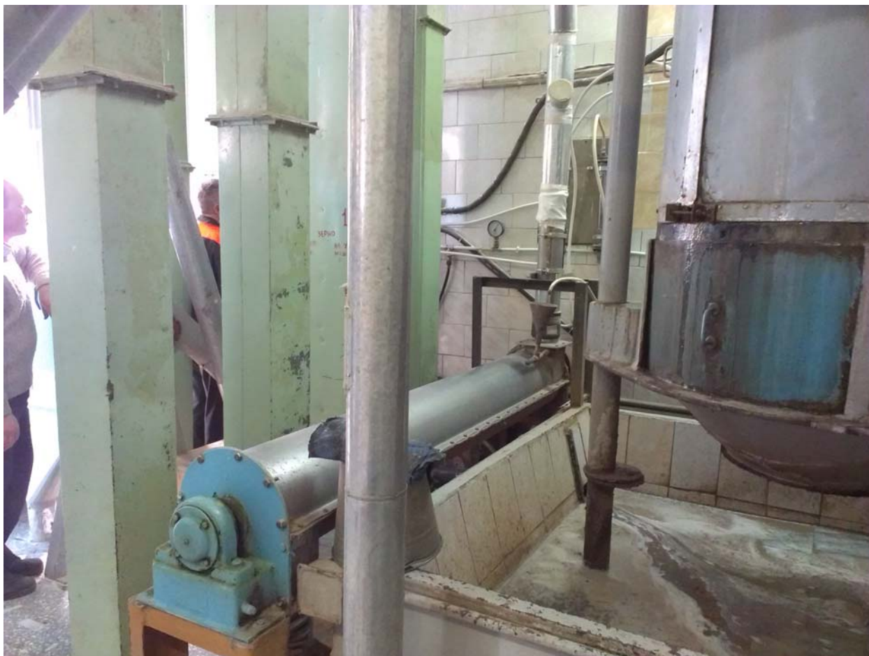
Общий вид БШУ

Система автоматического контроля и регулирования процессом увлажнения зерна перед помолом Микрорадар 200-01