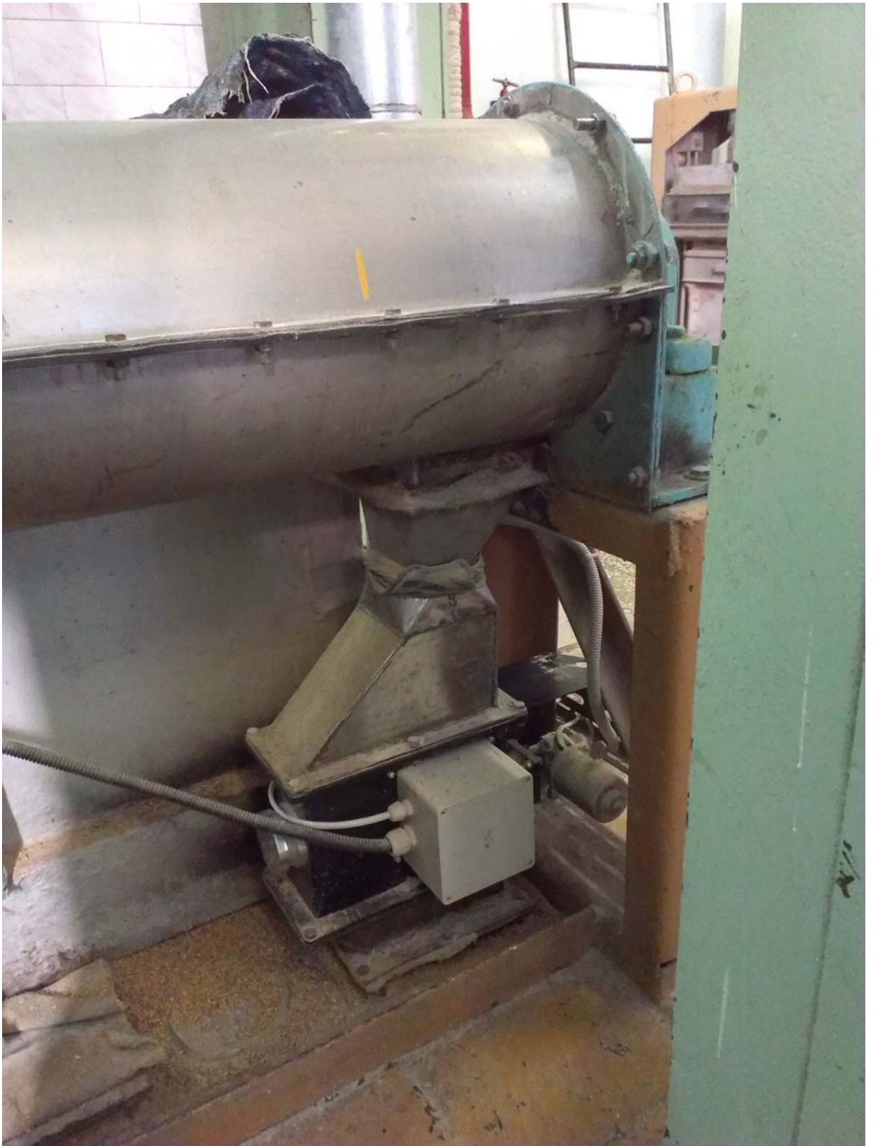
Фото установки влагомера на выходе из БШУ